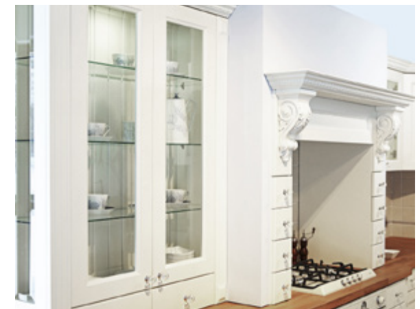
Cristal to kuchnia klasyczna w stylu angielskim. Białe fronty oraz dębowe blaty w naturalnym, ciepłym kolorze nadają jej przytulny, sielski charakter.